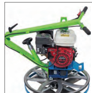
Manillar abatible para su fácil transporte