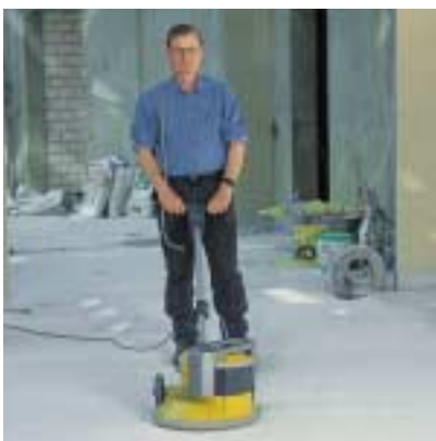
Schleifen mit dem Zusatzgewicht Grinding with a saddle weight

STR 703: Petrol driven – for trowelling, cleaning, grinding, moss and weed control