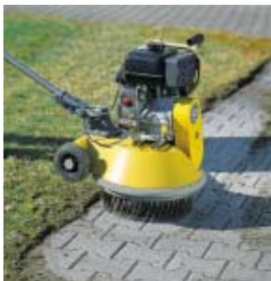
Entmoosen Moss & weed control