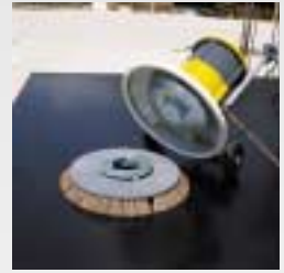
Werkzeugschnellwechsel Quick tool ex-change

Zubehör: Gleich welcher Einsatz, Schwaborn hat die richtige Lösung.