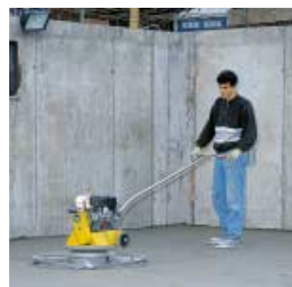
Glätten mit dem Flügel Trowelling with the wing float