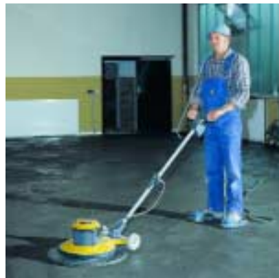
Glätten von Estrich mit dem Glätteteller Trowelling screed with the smoothing plate

STR 580: The right choice – easy to use, all-round performer for screed and concrete trowelling, grinding, sealing and cleaning.