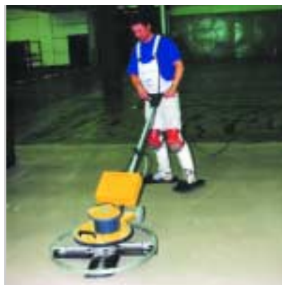
Glätten von Kunstharz mit dem Flügelglätter Trowelling resin with the wing float

STR 581: With variable speed control and soft start device – for trowelling concrete and resin floors.