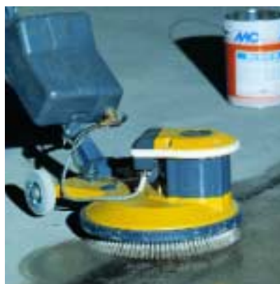
Reinigen, Imprägnieren und Polieren von Fußböden und Schalungen Cleaning, impregnation and polishing of floors and form work